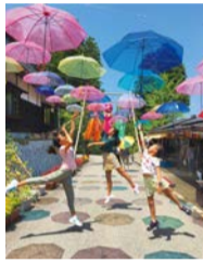
アンブレラスカイ

季節ごとに実をふくらませる樹木、美しい草花や昆虫、 ぶらりと歩けば発見がある自然いっぱいの空間です。 美しく広がる睡蓮の池の側には 山草、野草の魅力を満喫していただける山野草庭園。 小さな自然とのふれあう心休まる時間を お過ごしください。