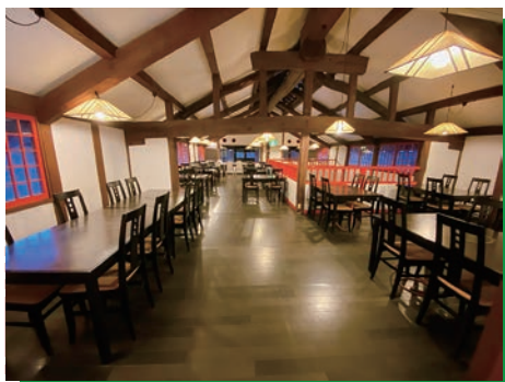
◆2階小広間 テーブル・椅子席80席