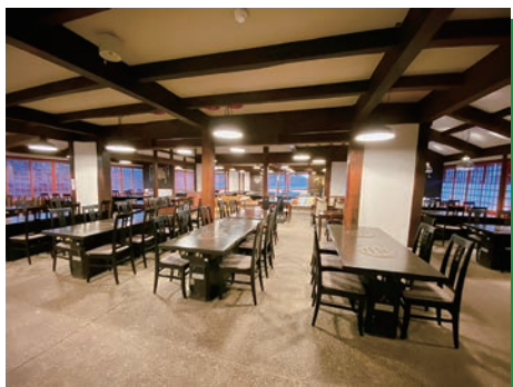
◆1階Bコーナー テーブル・椅子席100席(他座敷席有)