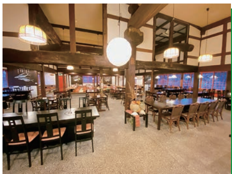
◆1階Aコーナー テーブル・椅子席100席(他座敷席有)