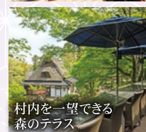
村内を一望できる森のテラス