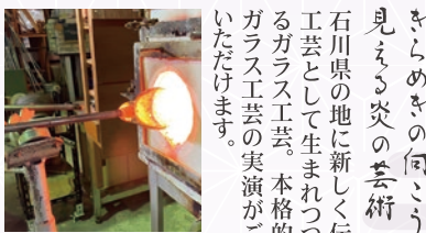
※吹きガラスの実演及び体験は臨時に休む場合があります。